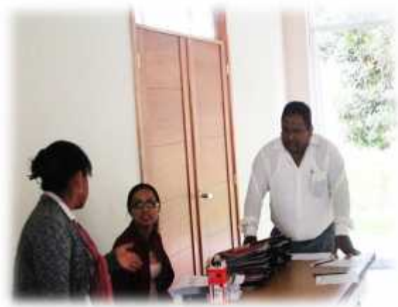
Preparando la mesa de inscripción