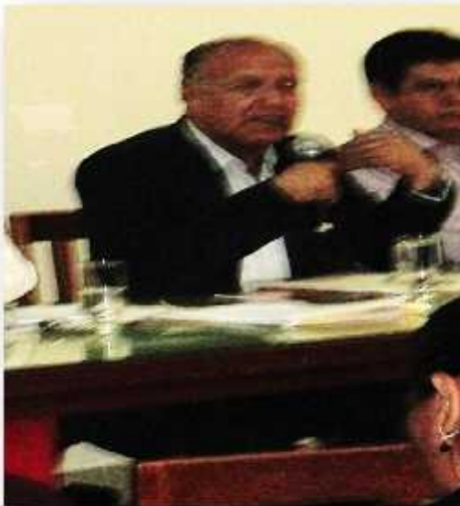
Expositor del Sector agrario

No hay que olvidar que esta norma se dio para favorecer principalmente a las empresas agroexportadoras asentadas en el ámbito del Proyecto Especial Chavímochic (Pech) como Danper, Camposol, Talsa, Agrícola Virú entre otras.