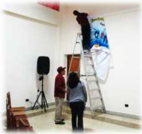
Colocando el BANNER del evento

2.1. El evento se inicia organizando el ambiente del encuentro e inscripción de los participantes, los cuales fueron llegando de manera diferida entre (8.30 a 10.00 am.). Iniciándose el evento dentro lo establecido.