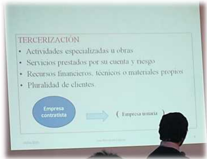
El exponente emplea proyecciones Sobre la tercerización laboral