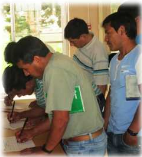
Inscripción de participantes al evento.